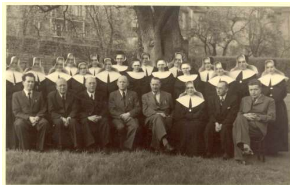
Obr. č. 14 – Absolventky ročníku 1942-1944