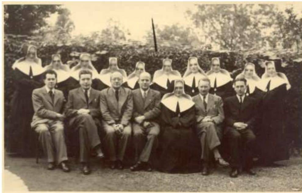
Obr. č. 12 – Absolventky 1942/1943