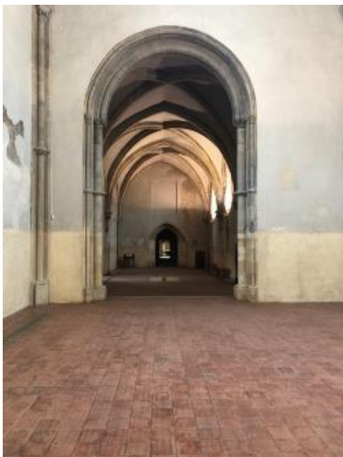
Pohled z chodeb v klášteře Anežky České