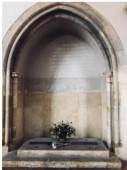
Náhrobek Anežky České