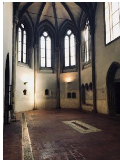
Presbytář – Kostel sv. Františka (13.st)