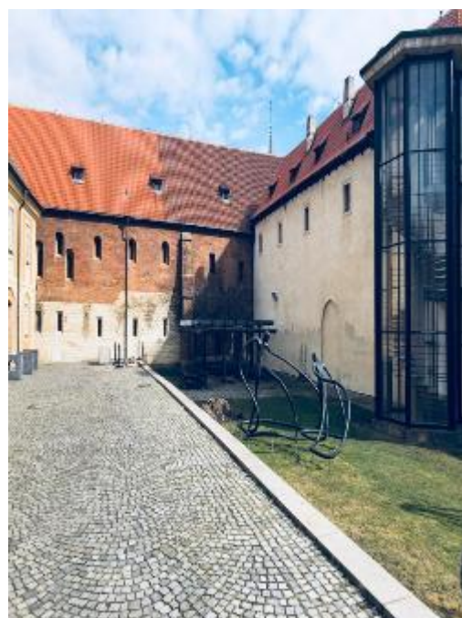
Pohled ze zahrad v Anežčíně klášteře