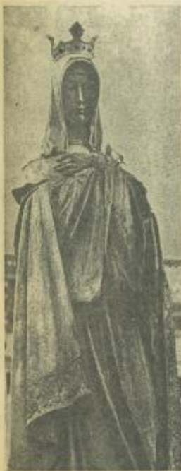
Podoba Anežky Přemyslovny neznáme. Takto si ji představoval na proslulé sousoší sv. Václava I. V. Mlýnské

hod v roce 1234 sama vstoupila. V téže roce na podzim přijal papež Řehoř IX. klášter v ochra- nu papežské stolicí a našel dosud Anežka za abatyši.