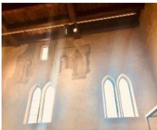
Zbytky nástěnných maleb