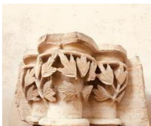
Trojité hlavice s listy černobýlu