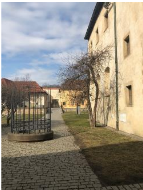
Pohled do zahrad Anežčina kláštera