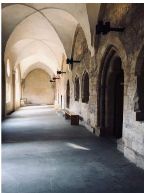
Jedna z chodeb Anežčina kláštera