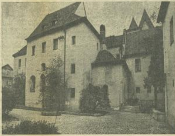
Dnešní Anežský klášter sloužil nejprve jako poštovní úřad českého království.