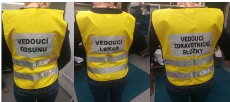
Obrázek 7 – vesty ZZS Jihomoravského kraje