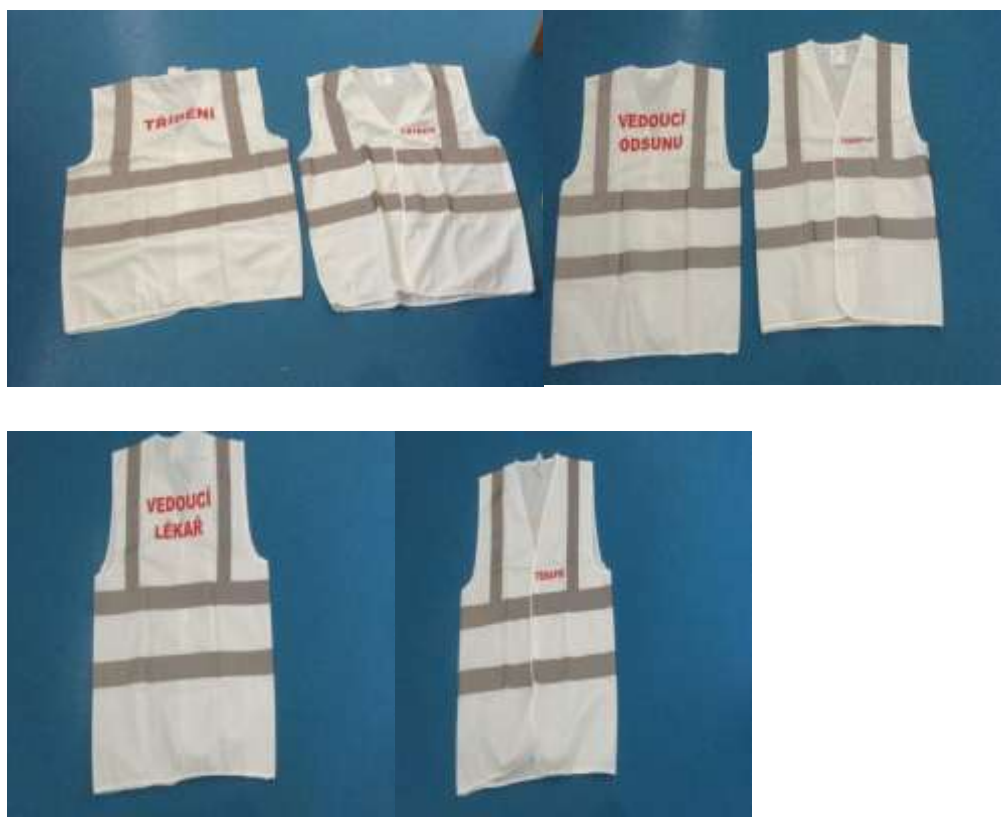
Obrázek 5 – Vesty ZZS kraje Vysočina