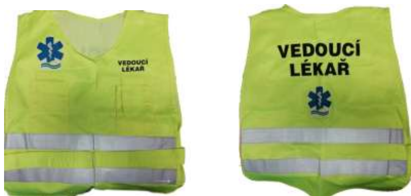
Obrázek 3 – Vesta ZZS Jihočeského kraje

Třetí otázka cílila na barevné provedení vest pro vedoucího zdravotnické složky, vedoucího lékaře a vedoucího odsunu. Zde se ukázala naprostá nejednotnost mezi sousedícími zdravotnickými záchrannými službami. Jediným jednotícím prvkem je jasné označení pozice konkrétní osoby na zádech vesty. Tato nejednotnost je velkou nevýhodou obzvláště v případech, kdy na místě mimořádné události zasahuje nejenom zdravotnická záchranná služba konkrétního kraje, ale též záchranné služby sousedících krajů. A vlastně nejenom záchranné složky. Lze předpokládat, že na místě mimořádné události většího rozsahu nebo v případě, že mimořádná událost vznikne u hranic krajů, bude zasahovat i Hasičský záchranný sbor a Policie České republiky jiných krajů, případně i další složky IZS. Nejednotné označení vedoucího zdravotnické složky, vedoucího lékaře a vedoucího odsunu může vést k mnoha zbytečným zmatkům na místě události.