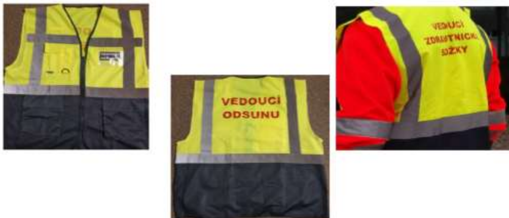
Obrázek 4 – Vesty ZZS Pardubického kraje