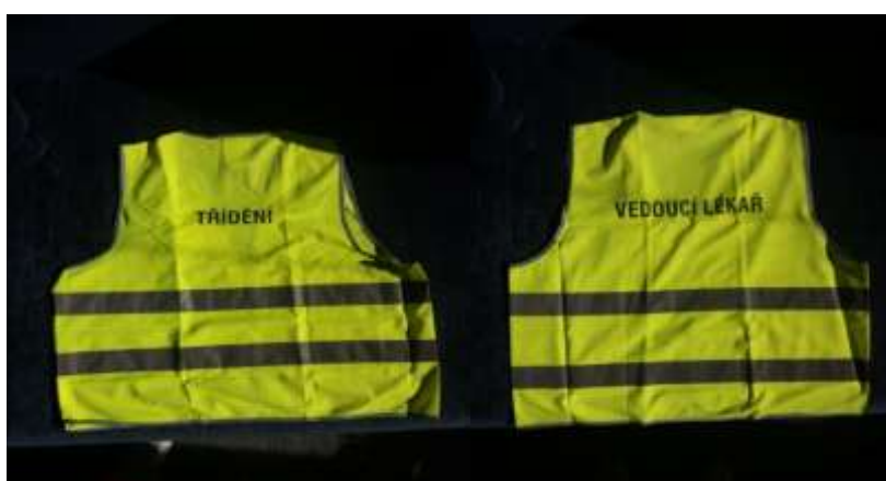
Obrázek 6 – vesty ZZS Olomouckého kraje