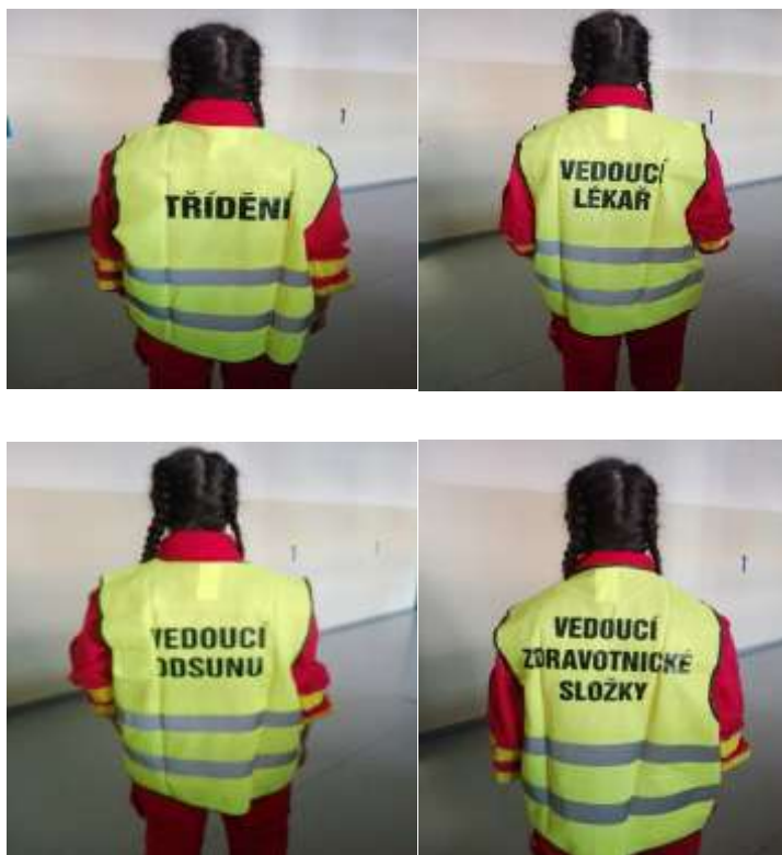
Obrázek 8 – vesty ZZS Zlínského kraje