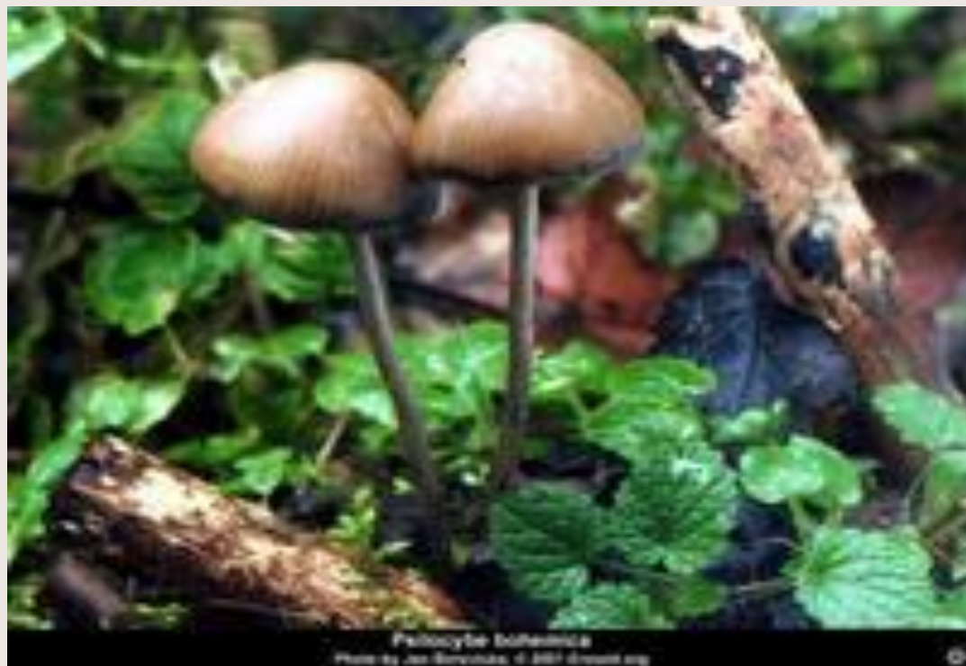
Lysichiton borealis