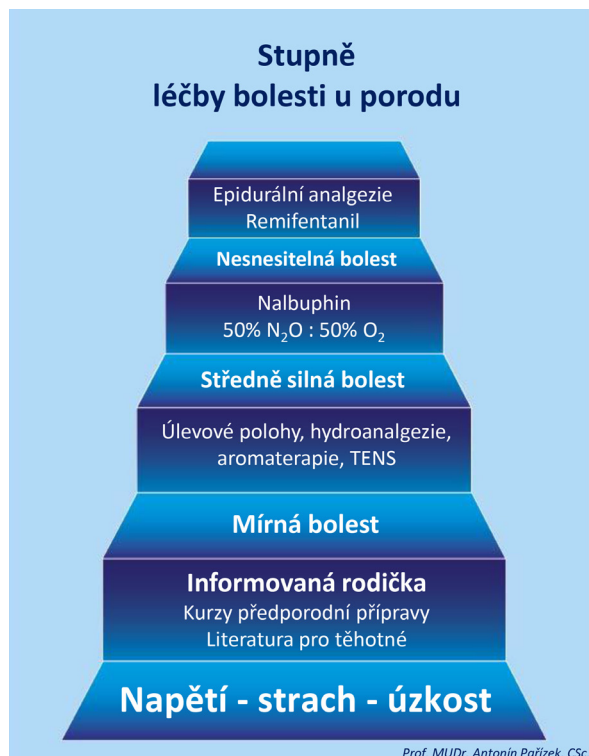
Obr. 1 Volba analgezie u porodu