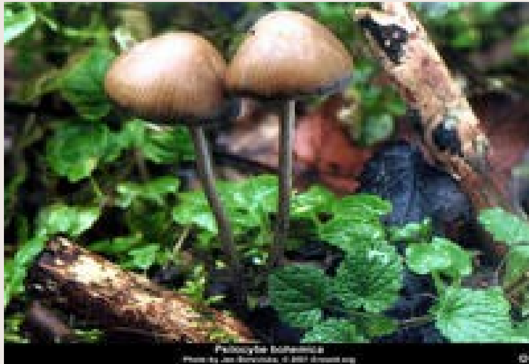
Lycoperdon obscurum