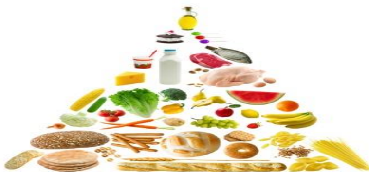
Obrázek 1 Výživová pyramida