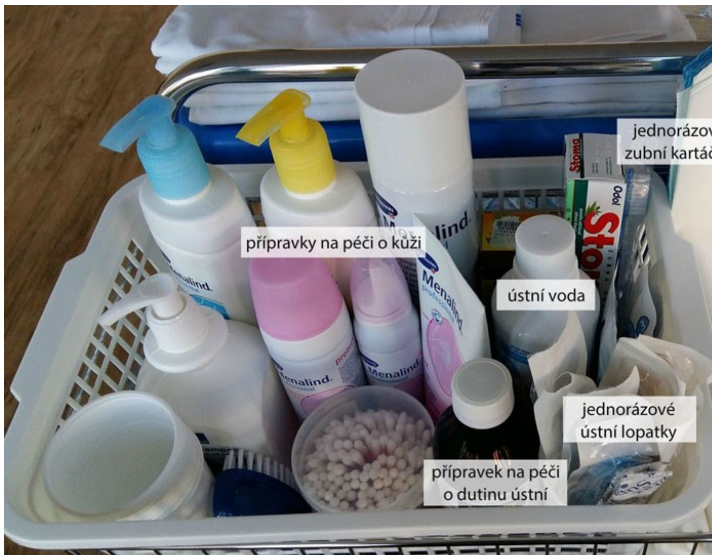
Pomůcky k péči o kůži a dutinu ústní