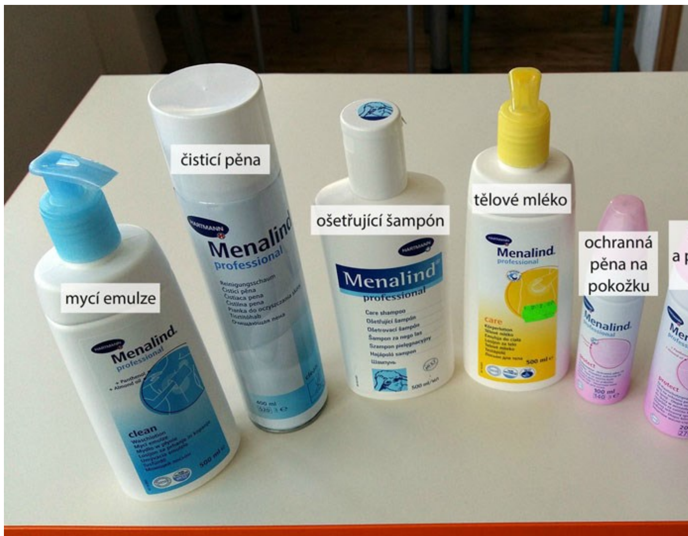
Péče o kůži – přípravky