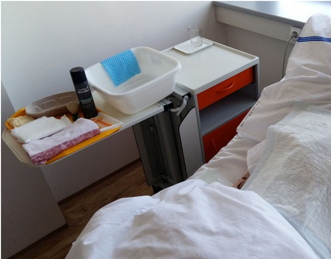
Příprava pacienta na holení