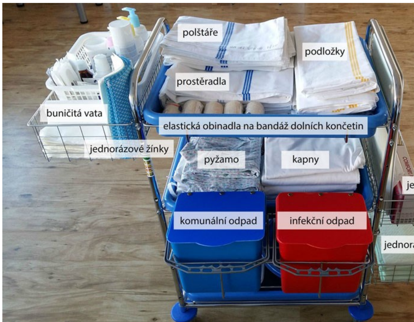
Vozík s pomůckami na hygienickou péči