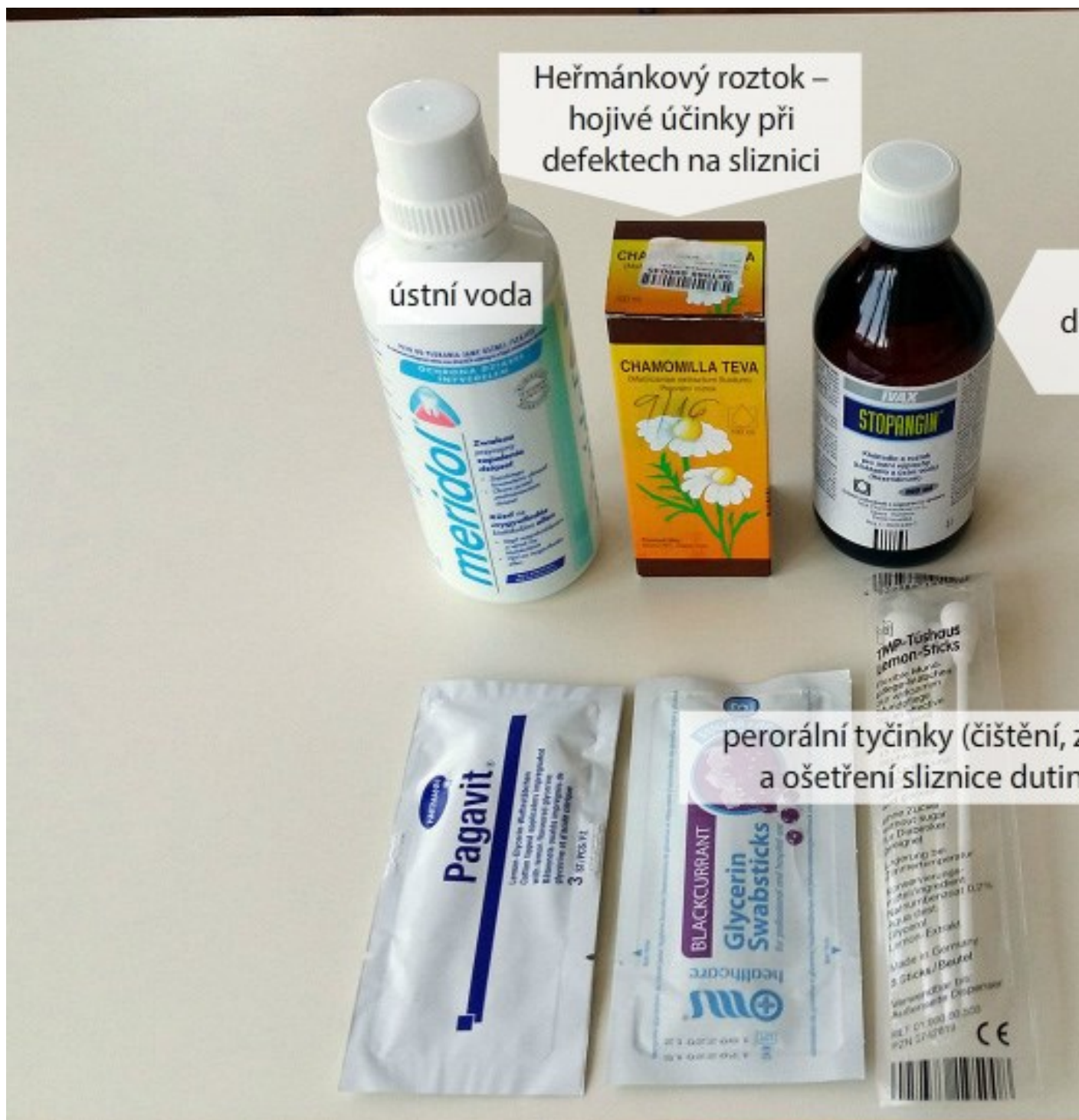
Přípravky k péči o dutinu ústní (perorální roztoky a perorální tyčinky)