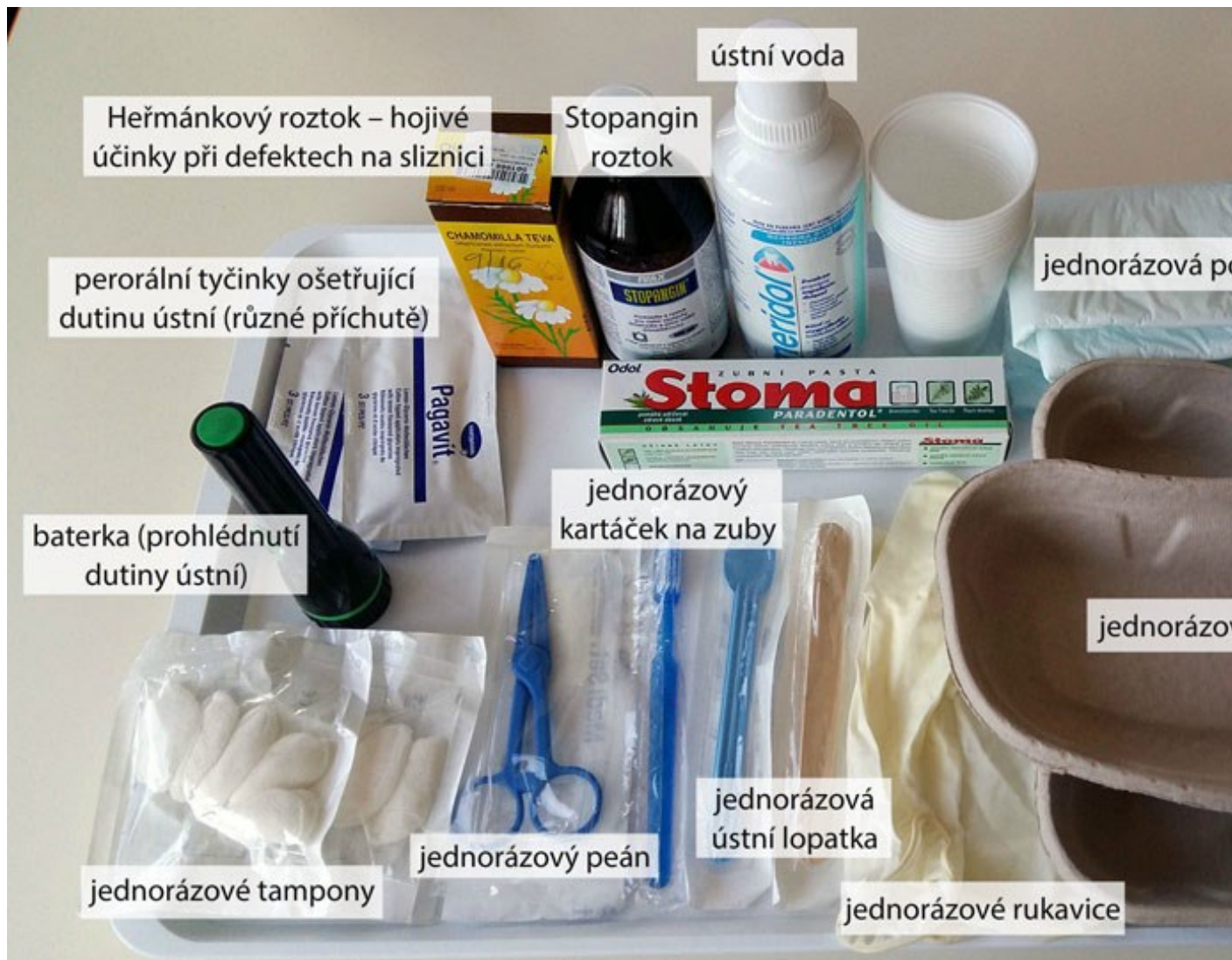
Pomůcky k péči o dutinu ústní