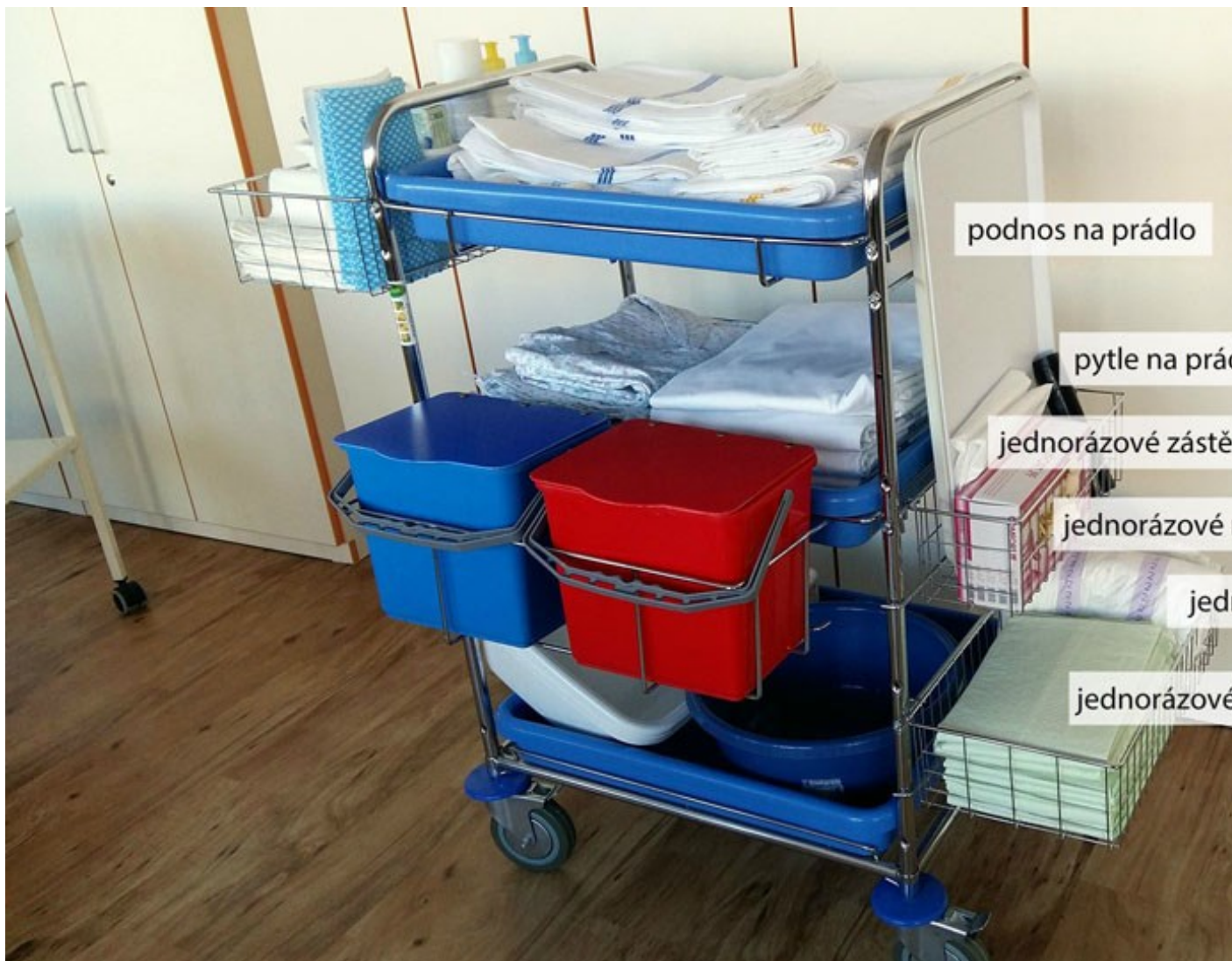
Vozík s pomůckami na hygienickou péči – boční pohled