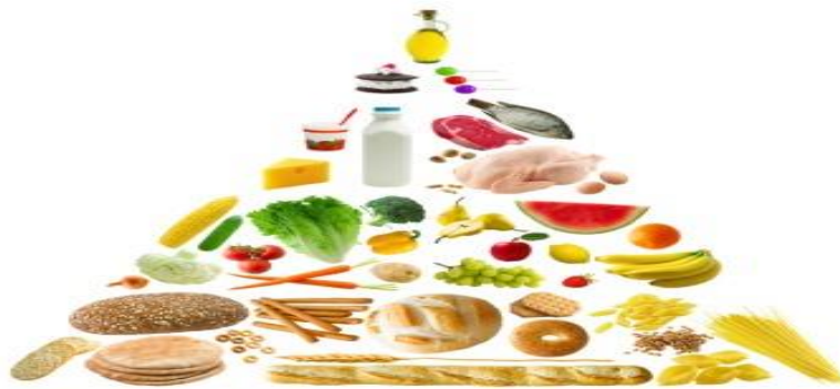
Obrázek 1 Výživová pyramida