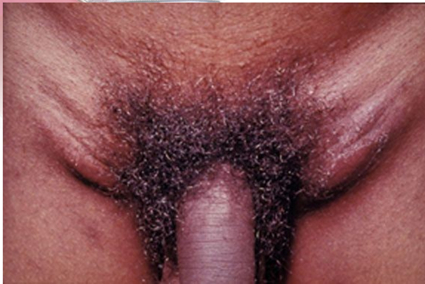
LGV u muže ve stádiu zduření uzlin