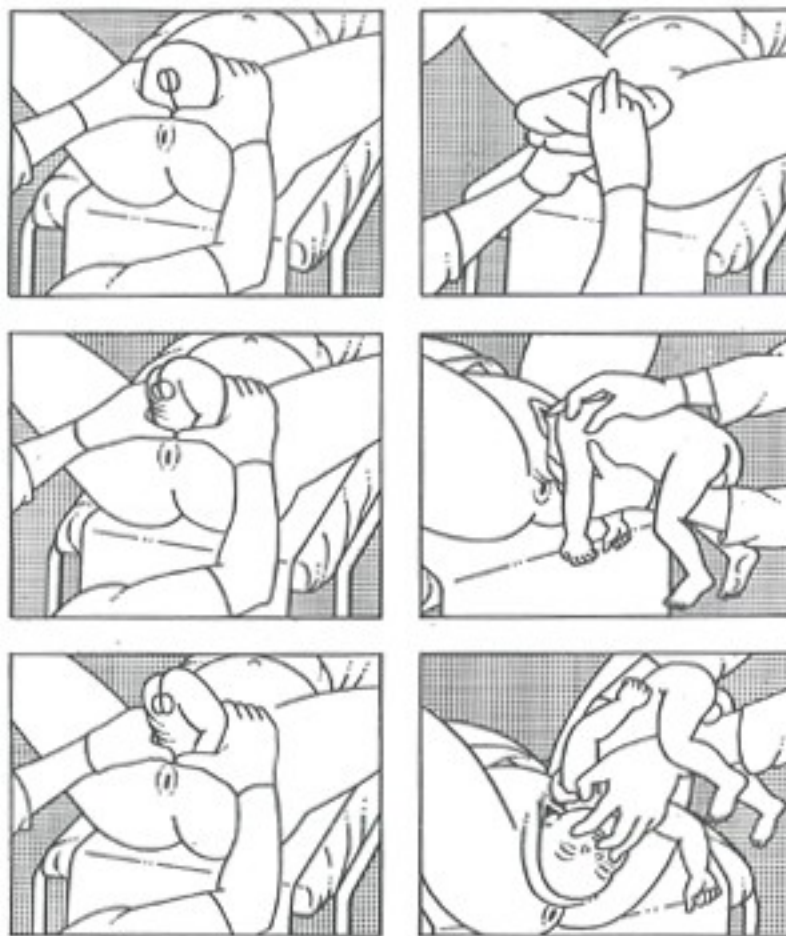
Obr. 7.33 Vedení spontánního porodu pánevními koncem podle Coe-Jensenové s manuální pomocí hlavičky. Při porodu je oblast hýždí zaroučkována